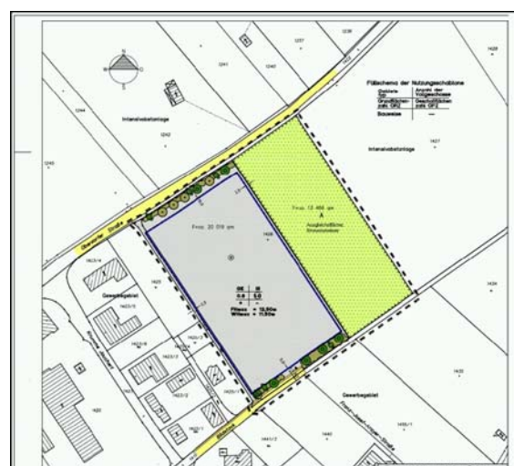
Plan der Gewerbegebietserweiterung (rechtskräftig ab Herbst 2008)