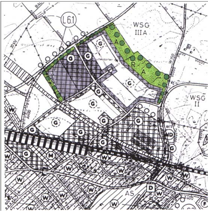
Plan Gewerbegebiet Krumme Jauchert - Mühlesch