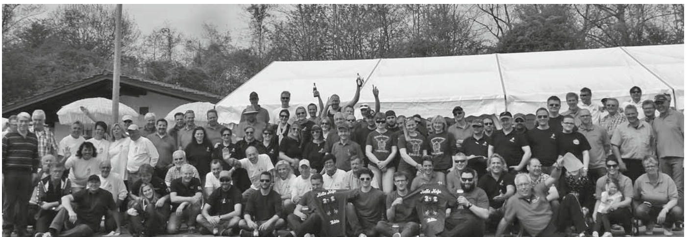
20 gemeldete Gruppen beim 26. Jedermannturnier des ESC spielten nach „knallharten Regeln“. Vom ersten Jedermannturnier an dabei: Der Angelsportverein und die Sportfreunde Oberdorf. Infos über den ESC: Im Schaukasten an der Bahnhofstraße.