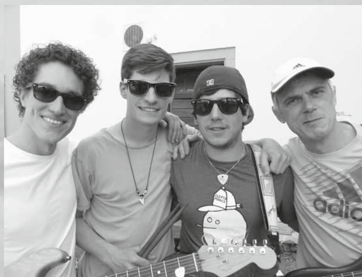
Die Schulstraße zeigt sich mit jungem Gesicht: Band4 mit Musik aus den 60ern und echten Langenargenern in der Combo – am Rathaus.