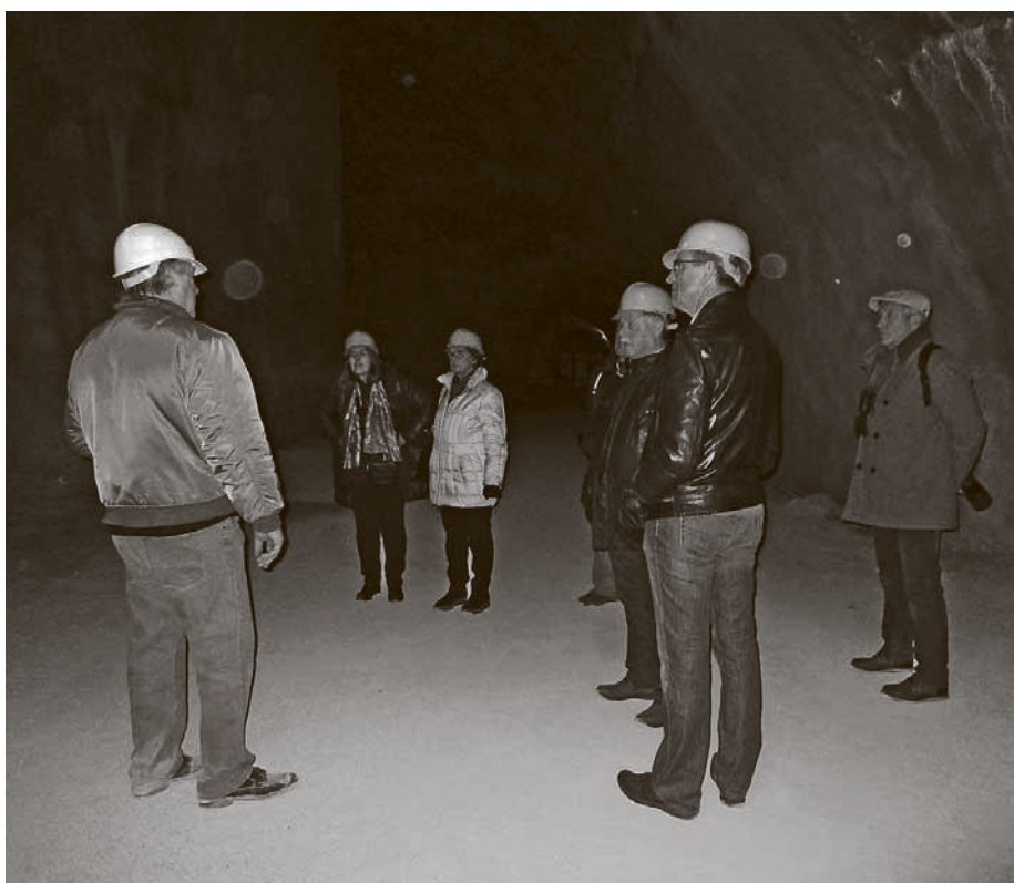
„Winter-Events des Tennisclubs Langenargen“ führte sieben Vereinsmitglieder und Gäste zu einem Besuch des Goldbacher Stollens nach Überlingen.