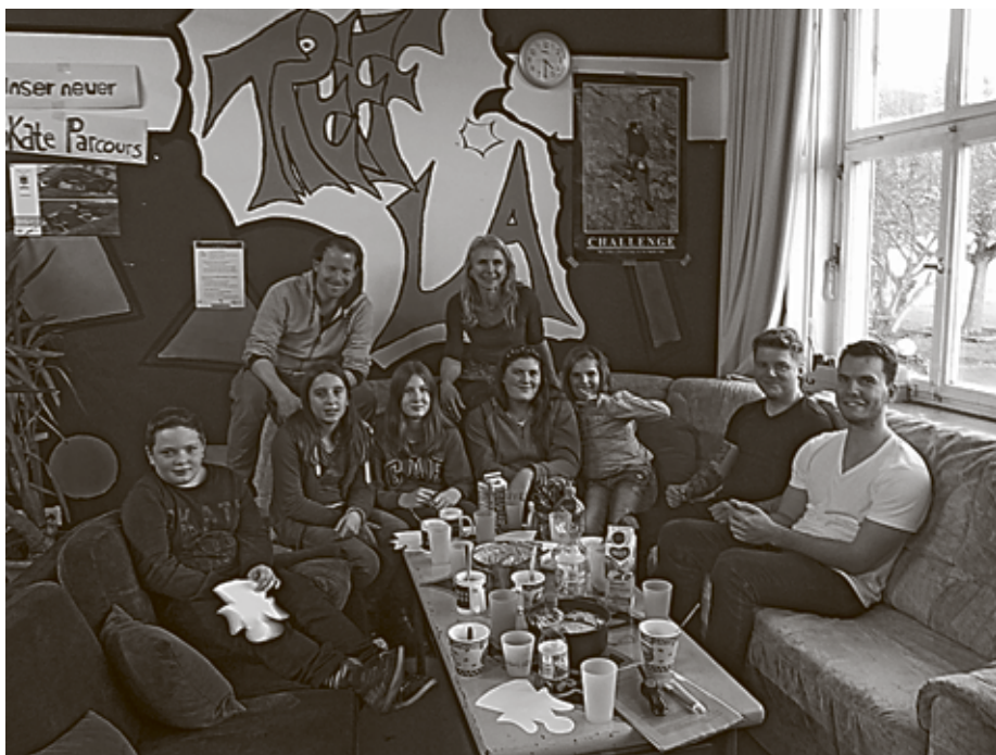
Der Treff-LA in den Räumen der Franz-Anton-Maulbertsch-Schule hat im Rahmen einer Weihnachtsaktion die Personen der Weihnachtsgeschichte und ihre geschichtlichen Hintergründe zum Thema.