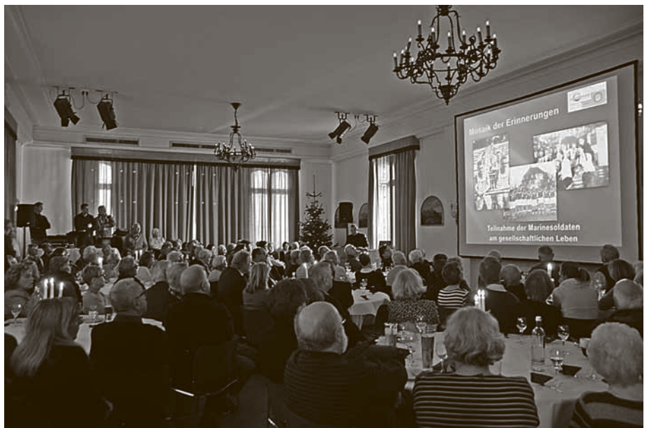
Zwei Drittel der Interessierten fasst der Saal an diesem Abend; eine Power-Point-Präsentation veranschaulicht die Zeitreise in eine Epoche, in der Langenargen Marinestützpunkt war.