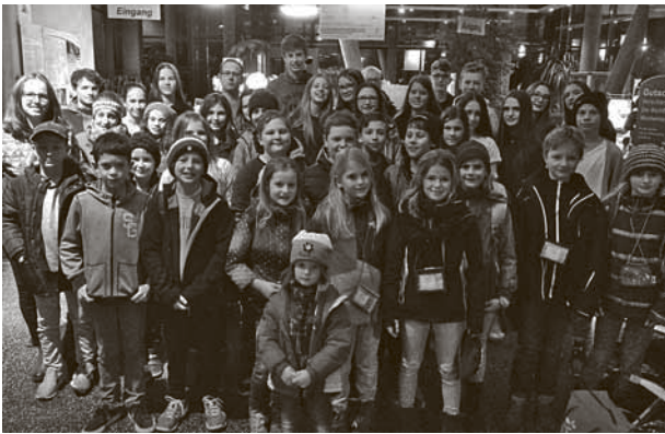
Der diesjährige Ausflug der Ministranten beider katholischen Kirchengemeinden führte die Kinder ins Thermalbad nach Überlingen.

Adventsfeier im Dorfgemeinschaftshaus in Oberdorf. Neben adventlicher Stimmung, Spiel und Spaß werden u. a. die neuen Oberministranten vorgestellt. Um 18.30 Uhr, nach einem gemeinsamen Essen, wird es einen besinnlichen Abschluss des Adventsnachmittags in der Oberdorfer Kirche bei der „Nacht der Lichte“ geben.