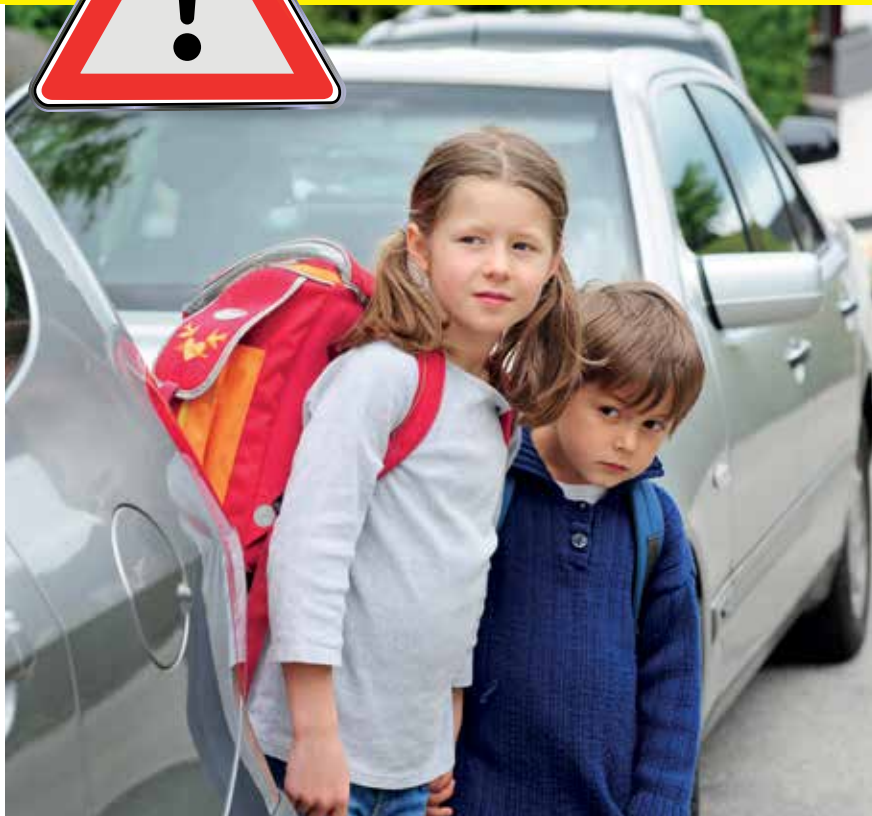
Achim Krafft Bürgermeister