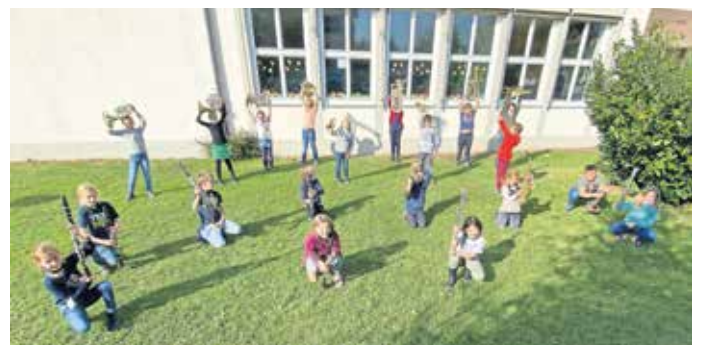
Die Bläserklassen an der Grundschule starten in ein musikalisches Schuljahr.

Seit Oktober erklingen ganz neue, mitunter auch noch schiefe Töne um die Mittagszeit aus der Musikschule. Zu hören sind mittels der Streichinstrumente und Blockflöten und donnerstags die Holz- und Blechbläser. Mit über 30 Kindern konnten die drei verschiedenen Musik-AGs des neuen Kooperationsprojekts zwischen der Musikschule Langenargen und der Franz-Anton-Maulbertsch-Schule sehr erfolgreich starten.