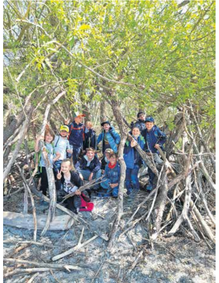
Beim Osterausflug bauen sich die Kids ein Tipi.

Die Karwoche stand ganz im Zeichen des nahenden Osterfestes und alle bastelten mit Feuereifer ihr eigenes Osternest und alle suchten und mitnehmen durften. Der Osterhase hoppelte freundlicherweise bei uns vorbei und ließ einige Süßigkeiten in den Nestern zurück.