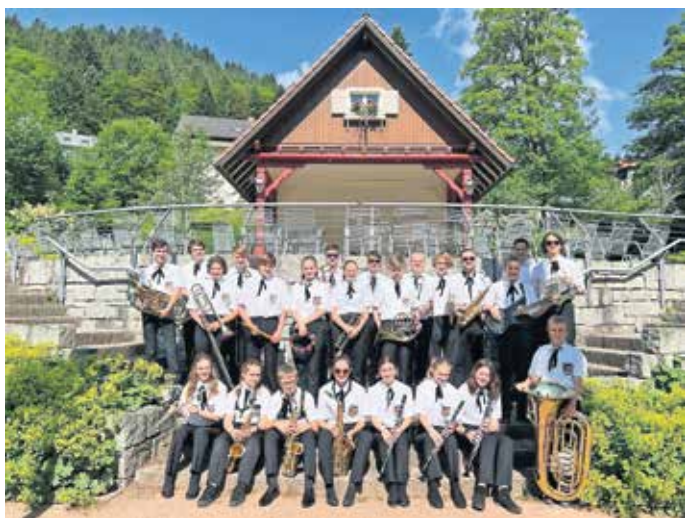
Schön ist es im Schwarzwald - das Jugendblasorchester genießt Konzertreise und Ausflug.

Endlich war es wieder soweit: Nach der langen Coronapause ging ein lang ersehnter Wunsch für die jungen Musikerinnen und Musiker des Jugendblasorchesters Langenargen endlich in Erfüllung. In der zweiten Woche der Pfingstferien wurden die Koffer und die Instrumente gepackt für die Konzertreise nach Todtmoos in den nahegelegenen Schwarzwald. Nach einem kurzen Zwischenstopp an der Rodelbahn in Todtnau wurden im Anschluss die Betten im Europäischen Gästehaus bezogen.