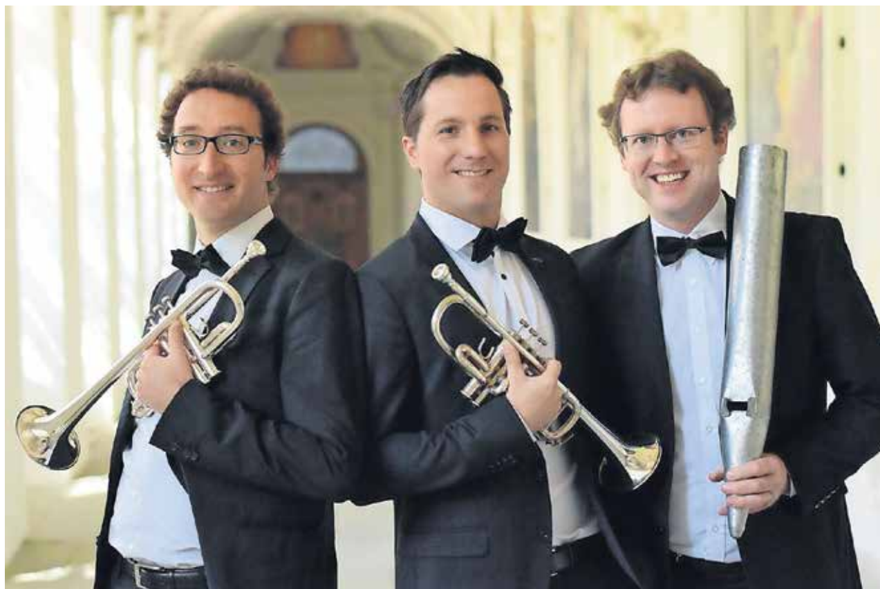
Bild: Trio Toccata