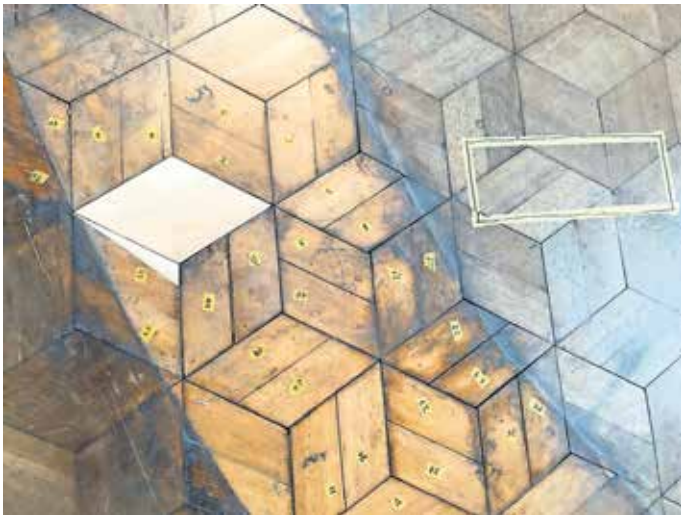
Detail einer bestandsgerechten Parkettbodenreparatur im Erdgeschoss Schloss Montfort, Langenargen

Um an den Führungen teilzunehmen, ist eine Voranmeldung bei der Tourist-Information unter der Telefonnummer 07543 933092 oder per E-Mail an touristinfo@langenargen.de erforderlich. Die Teilnehmerzahl ist begrenzt, daher wird eine rechtzeitige Reservierung empfohlen.