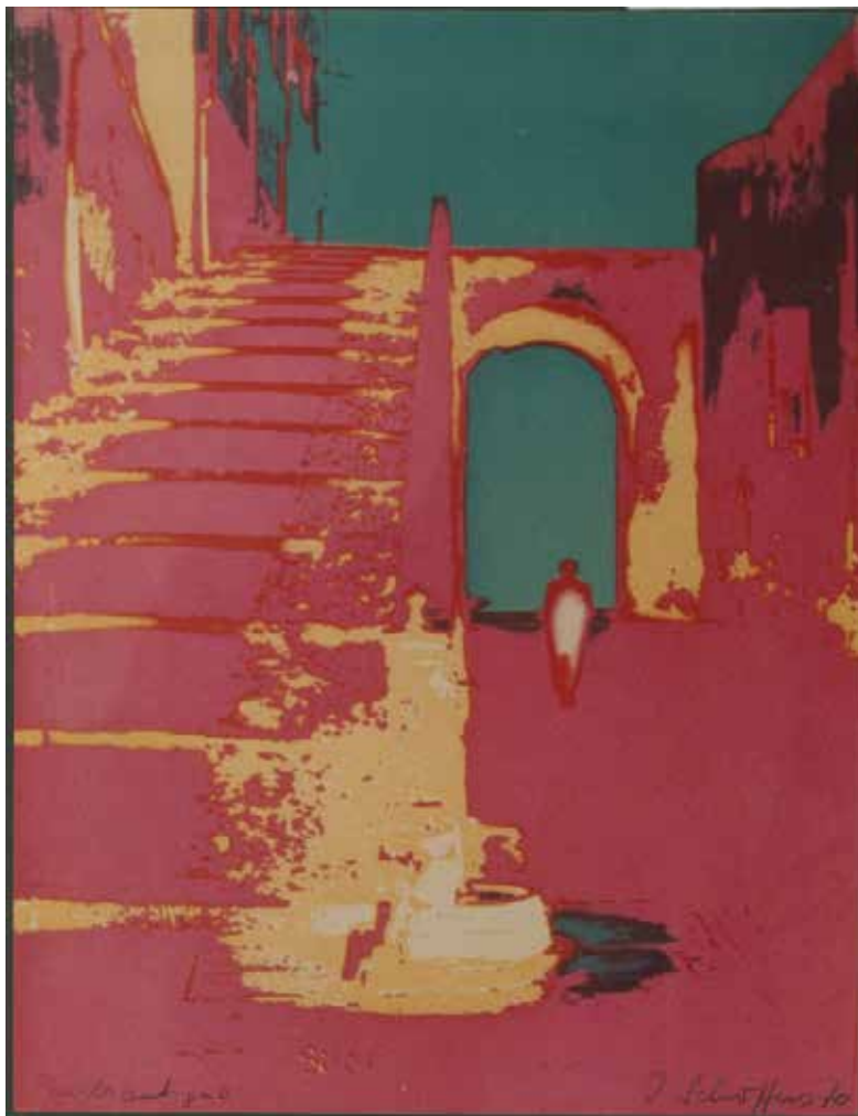
Irm Schoffers: Pueblo Antiguo (Farbvariante), 1970, Galerie in der Lände, Kressbronn

Dauer der Ausstellung: 9. August bis 30. November 2024