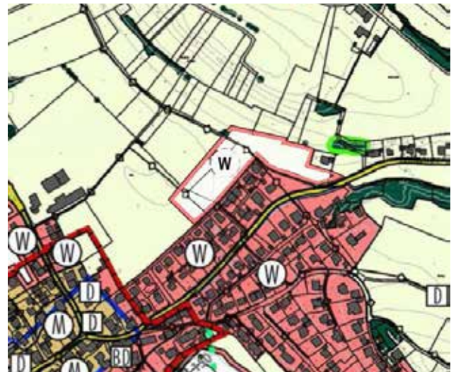
5. Änderung Bereich Moos I

Änderungsbereich „Bachtobel“ (Flächenkompensation) Herausnahme von ca. 1,35 der geplanten Wohnbaufläche aus dem Flächennutzungsplan. Eine Fläche von 0,4 ha bleibt östlich der Tettnanger Straße als geplante Wohnbaufläche im Flächennutzungsplan erhalten.