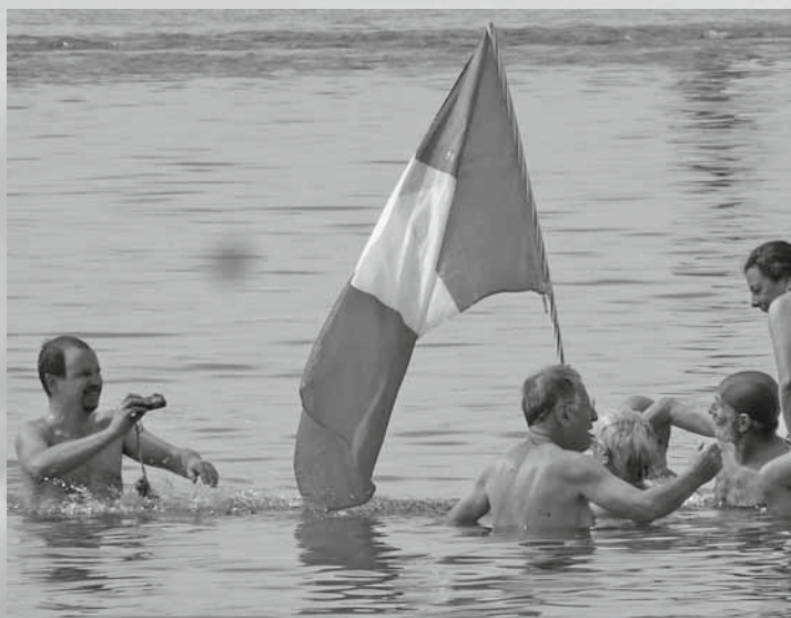
Bei knapp 11 Grad kühlem Wasser gemütlicher Fototermin der italienischen Freunde mit Landesflagge.