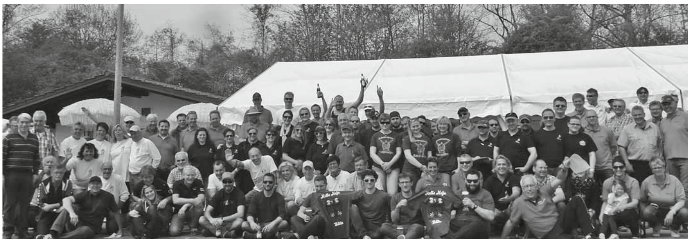
20 gemeldete Gruppen beim 26. Jedermannturnier des ESC spielten nach „knallharten Regeln“. Vom ersten Jedermannturnier an dabei: Der Angelsportverein und die Sportfreunde Oberdorf. Infos über den ESC: Im Schaukasten an der Bahnhofstraße.