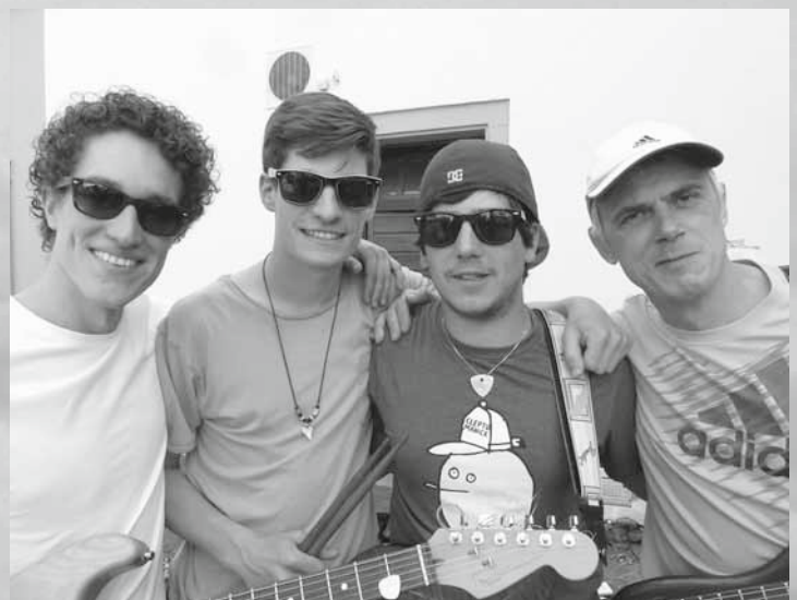
Die Schulstraße zeigt sich mit jungem Gesicht: Band4 mit Musik aus den 60ern und echten Langenargenern in der Combo – am Rathaus.