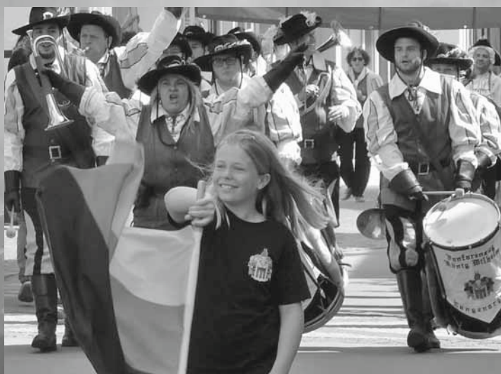
Der Fanfarenzug König Wilhelm mit dem Grafenpaar und der gräflichen Gefolgschaft setzt sich vom Umlandplatz über die Schulstraße in Bewegung.