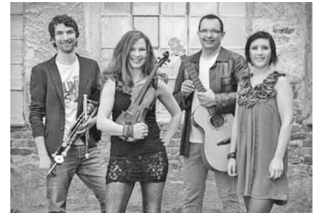
Die deutsche Irish-Folk Band „Cara“ spielt am 13. Mai, 20 Uhr, im Münzhof.

Karten gibt es bei der Tourist-Information Langenargen, Tel. 07543 - 933092 sowie bei allen Reservix-Vorverkaufsstellen. Der Eintritt beträgt 18 €/ermäßigt 16 €/mit der AboKarte der Schwäbischen Zeitung: 14,40 €.