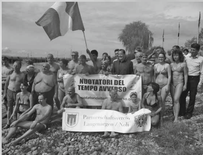
Saisoneröffnung 11.30 Uhr, offizieller Pressetermin zum Anschwimmen mit dem Partnerschaftsverein Langenargen-Noli.

Eine wirklich gelungene Veranstaltung nach dem Motto einer geliebten Partnerschaft. Die vielen Besucherinnen und Besucher haben dieses Event mit viel Applaus belohnt. cw