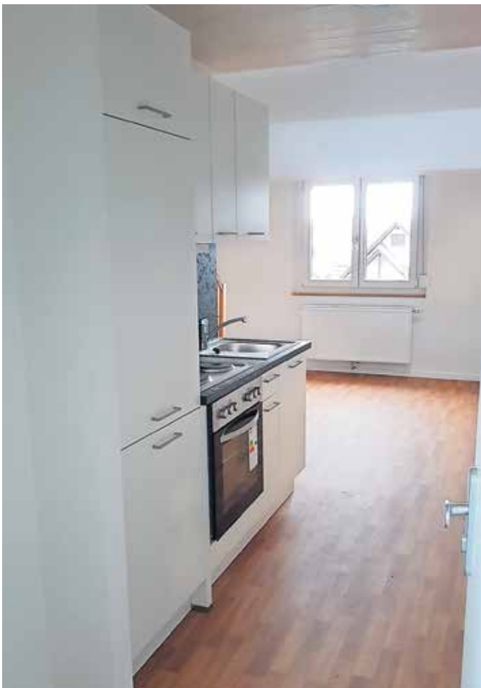
Küche in der Wohnung der Anschlussunterbringung.

Der Jahreskartenvorverkauf für das Strandbad Langenargen findet in diesem Jahr am Fr., 03.05.2019 von 15:00 Uhr bis 19:00 Uhr, Mi., 08.05.2019 von 16:00 Uhr bis 21:00 Uhr und Do., 09.05.2019 von 16:00 Uhr bis 21:00 Uhr statt. Alle Vorverkaufstermine finden im Hallenbad Langenargen in der Amthaustraße statt. Gerne können Jahreskarten auch telefonisch unter 0800 / 0786 786 oder per E-Mail unter kontakt@pvm-service.de unter Angaben