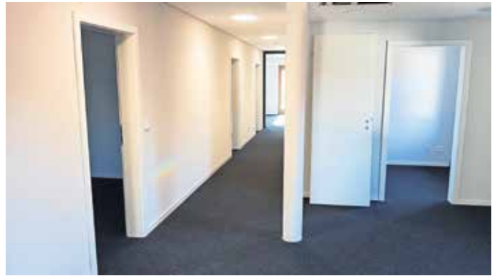
Innenansicht des Verwaltungszentrums in Oberdorf.