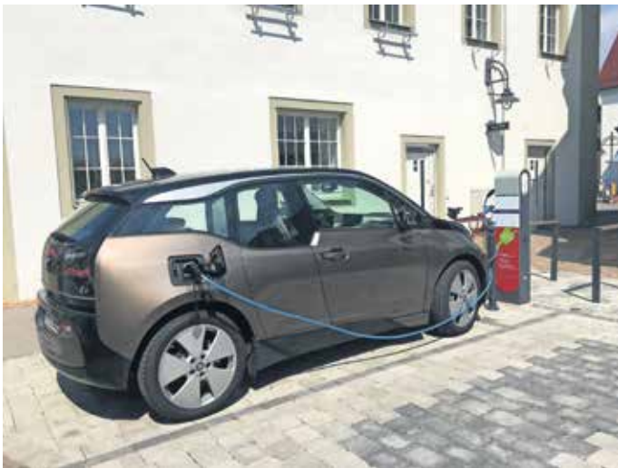
E-Ladesäule am Rathaus.