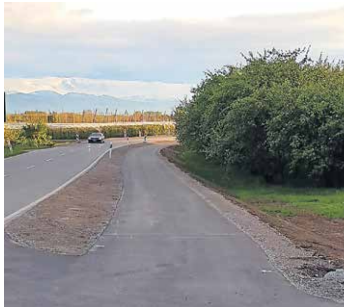
Der Radweg in Mückle.