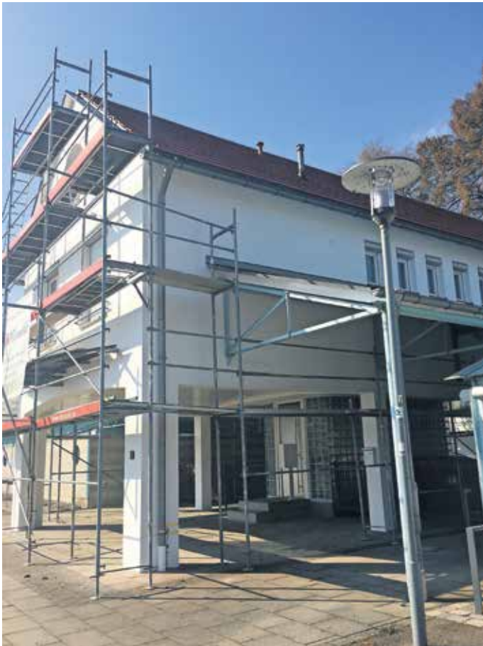
Das eingerüstete Gebäude des Strandbads.