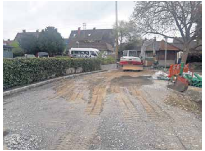
Alarm-Parkplatz beim Feuerwehrhaus.