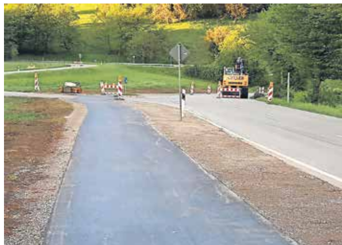
Radweg in Mückle.