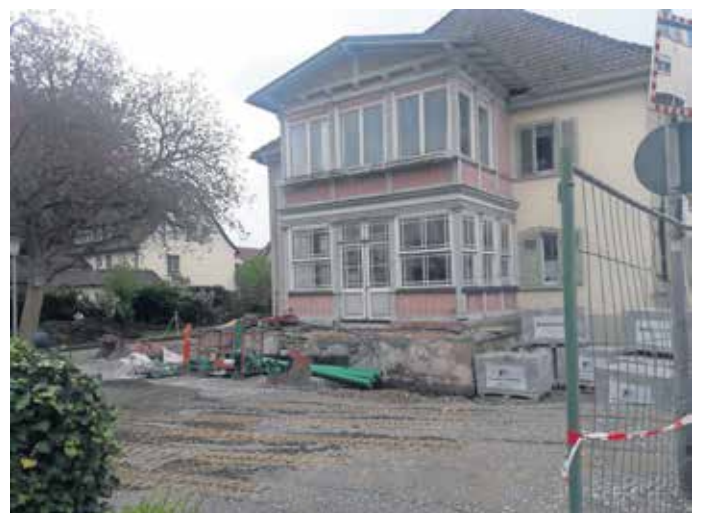
Außenanlage der Villa Wahl.