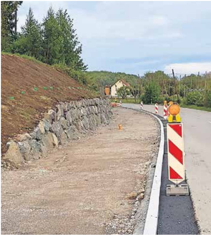
Radweg in Mückle.