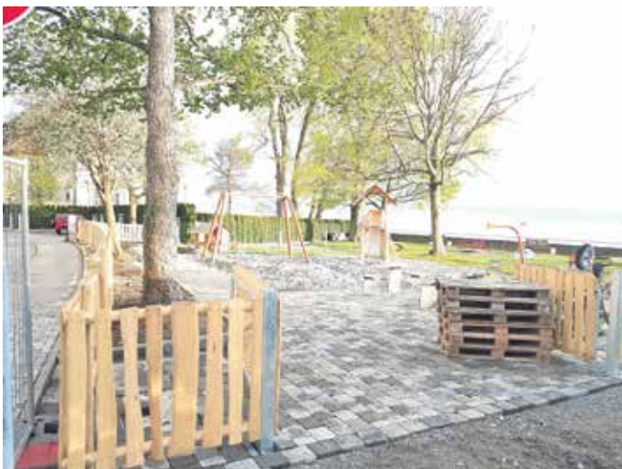
Spielplatz am Institut für Seenforschung.